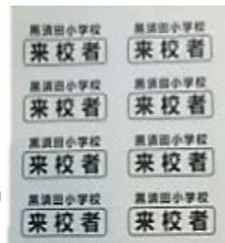
▲来校者名札シール