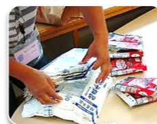
仕分け 一枚ずつロゴマークを確認する