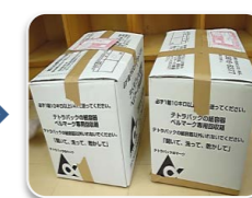
発送 業者に連絡・発送する