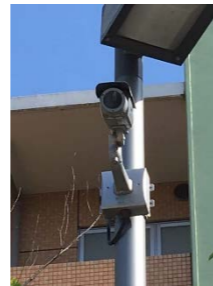
▲防犯カメラ(計4台) ※録画されています