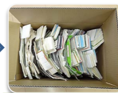
箱詰め 10キロ単位で箱に詰める