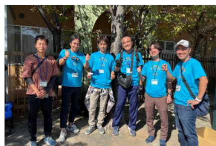
当日はボランティア団体の「パパっとクラブ」の皆さんが設営のお手伝いをしてくださいました。

10月21日に運動会2023が行われました。 運動会警備受付係の皆さまに積極的にお手伝いいただいたおかげで、大きな混乱なく運動会を行うことができました。ご協力ありがとうございました。また、保護者の皆さまにおかれましては名札のご提示、受付経路の整列入場にご協力いただきましてありがとうございました。 ささやかではございますが、PTAより運動会の記念品をお子様にごプレゼントいたしましたので、ご活用ください。