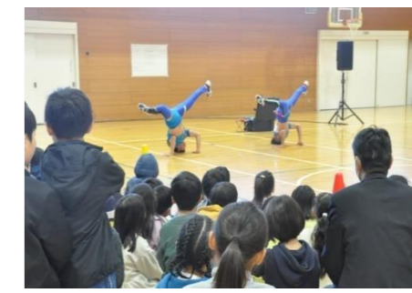
先生も参加しアドリブで披露