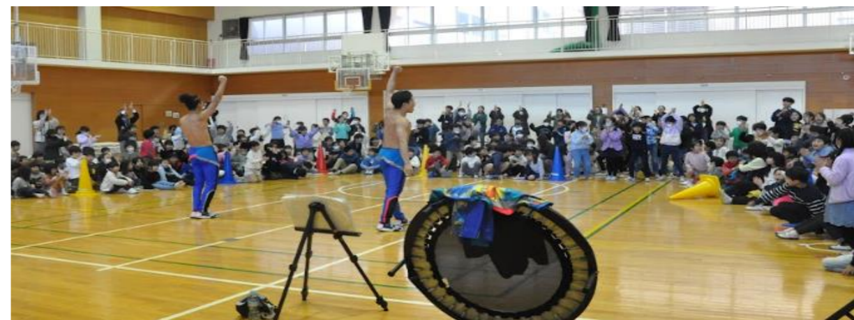
子どもたちも立ち上がり、大歓声で盛り上がっていました