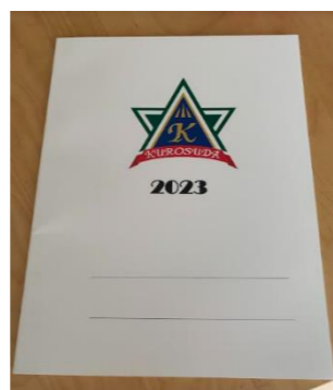
今年の記念品は校章入りB5ノートです