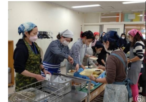
子ども達と同じように自分達で配膳を経験して、懐かしい気持ちになりました！