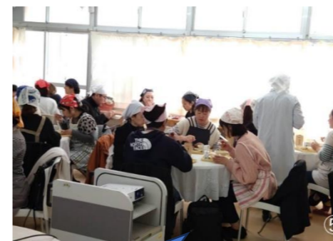
とっても美味しい♪